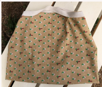
エコバッグ 550円(税込)